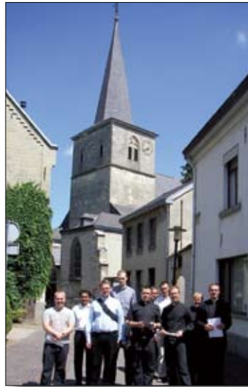
Eine Gruppe Seminaristen vor der Pfarrkirche von Valkenburg.